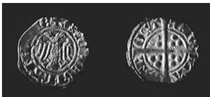
Robrecht van Bethune, sterling met de arend

Wat zijn de nu nog openblijvende vragen, vooral voor wat de muntslag te Dendermonde betreft?