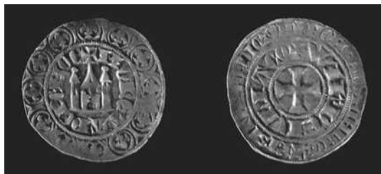
Groot van Dendermonde met ✠WIL' : DE : IVLIACO

De eersten in de reeks zijn Jan van Namen en Willem van Gulik. Van deze laatste is er een groot van goed gehalte bekend met daarop een Brabantse (stads)poort, geslagen te Dendermonde, waarop hij de titel aanneemt van ✠WIL' : DE : IVLIACO.