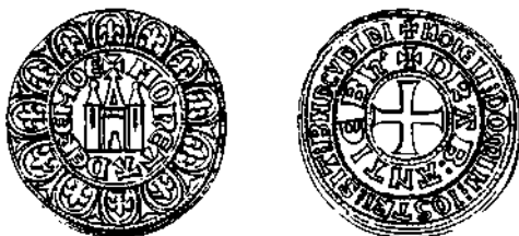
Groot van Dendermonde met DRAB:ANTIE Dh'

De eerste is terug een groot met Brabantse stadspoort, van slecht gehalte, geslagen te Dendermonde, maar op de voorzijde leest men DRAB:ANTIE Dh' en op de keerzijde MONETA DEREMOE. Is het de gemeenschappelijke munt die in 1300 door de omstandigheden niet kon geslagen worden en dan onder één van de regenten uiteindelijk toch geslagen werd, of is dit het product van de bijeenkomst, waarvan we weten dat ze in 1304 in Dendermonde plaatsgreep en waarop gesproken zou worden over een muntovereenkomst tussen Brabant en Vlaanderen? Wat we zeker weten is dat ze werden gevonden in de vondsten van Brussel, "rue Montagne des Géants" en van Leuven die beiden verstoep werden in 1303 of 1304.