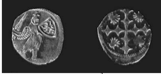
G.61 (schaal 2/1 )

Vier van deze kleine deniertjes werden ooit toegeschreven aan Dendermonde.