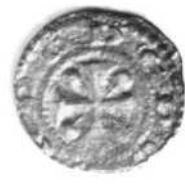
Denier met stadspoort