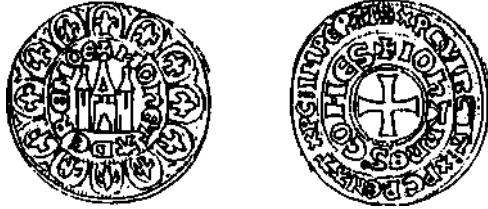
Groot van Dendermonde met ✠IOHANNES COMES

Tenslotte zal hij zich op de groot van Aalst (G.162), die dan weer van goede kwaliteit is, ✠I : F : COIT' FLAND (zoon van de graaf van Vlaanderen) noemen.